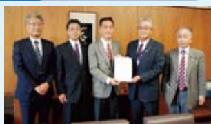
成瀬徳夫市議会議長