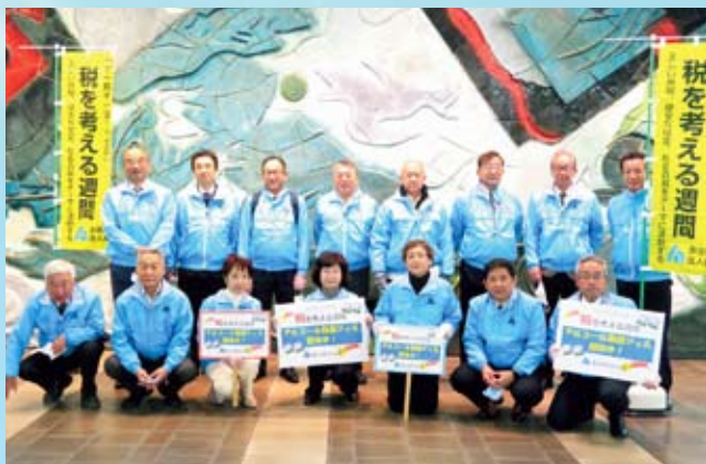
多治見支部 JR 多治見駅にて