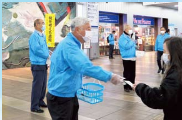
多治見支部 JR 多治見駅にて