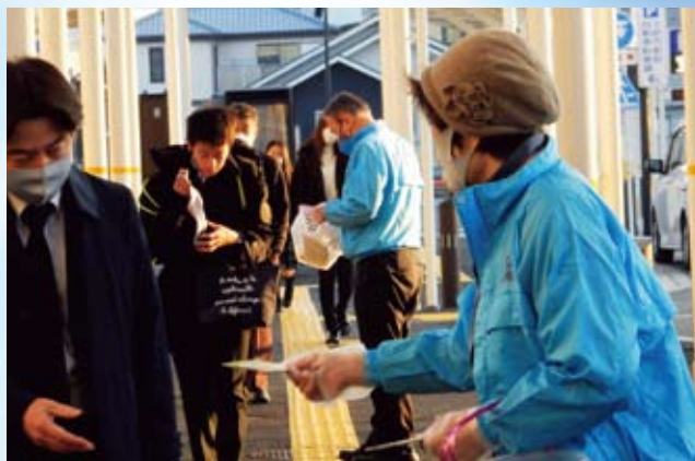
土岐支部 JR 土岐市駅にて