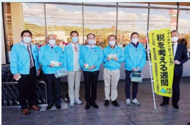
瑞浪支部 バローにて