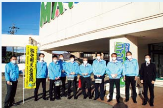
瑞浪支部 メイトにて