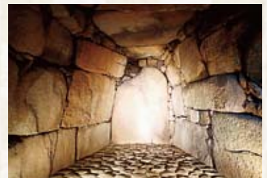
横穴式石室 全長 19.2 m (美濃知用最大級)