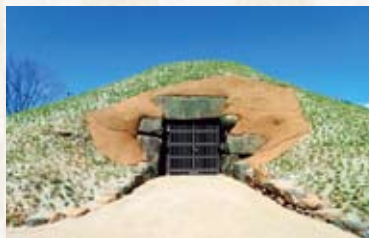
方墳（上から見ると四角形） 南北 27.4 m、東西 26.1 m、残存高 5.8 m