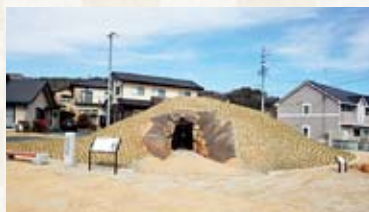
円墳（上から見ると円形） 直径 23.9 m、残存高 4.1 m