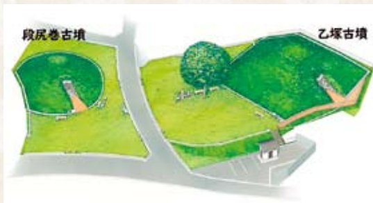
【乙塚古墳附段尻巻古墳】