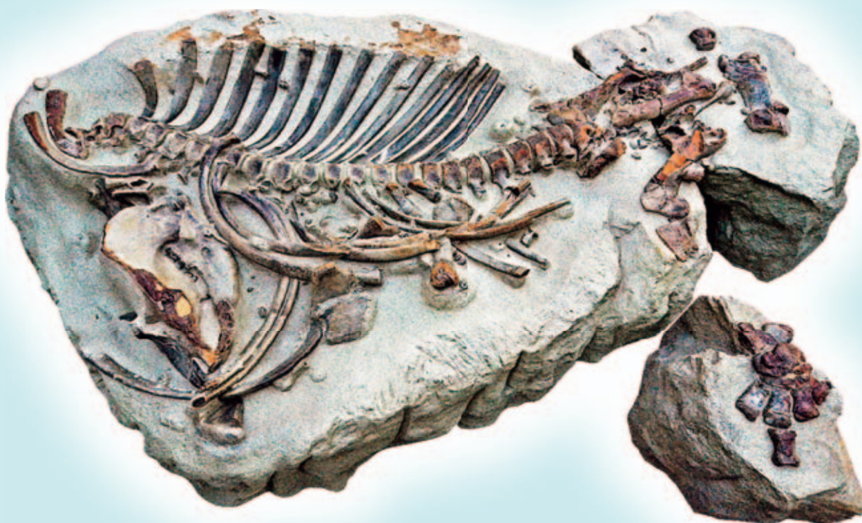
パレオパラドキシア瑞浪釜戸標本