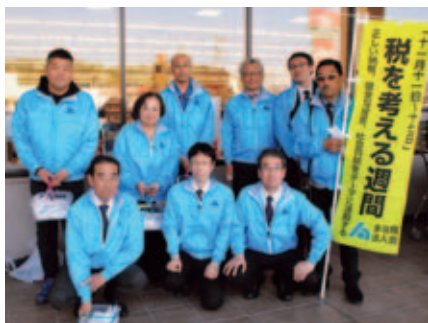
瑞浪支部 バローにて