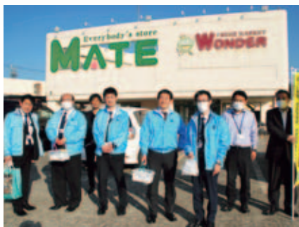
瑞浪支部 メイトにて