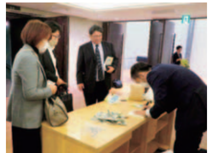
サイン入り書籍販売 55冊売れました！