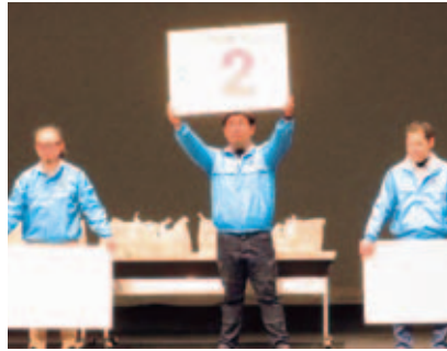
税金クイズ回答パネル